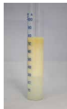
Mauvaise séparation Réduit la durée de vie du fluide