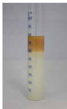
Bonne séparabilité Facile à enlever

1 = Excellent 2 = Bon 3 = Moyenne 4 = Mauvaise séparation